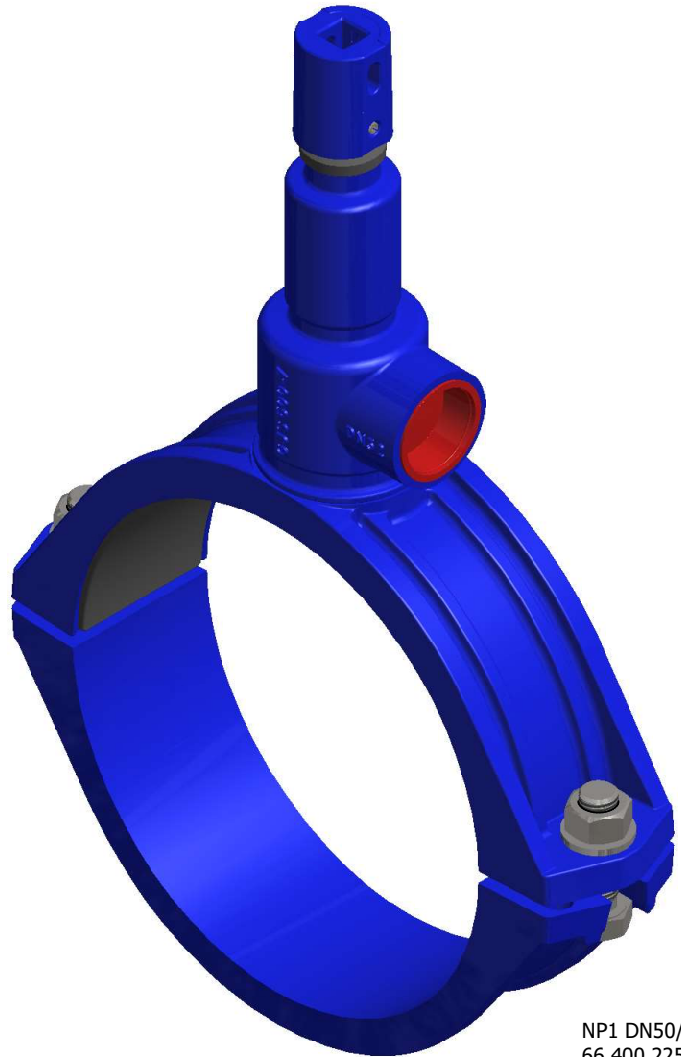
NP1 DN50/225 66.400.225.050