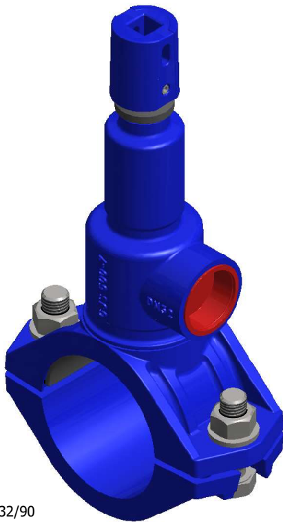
NP1 DN32/90 66.400.090.032